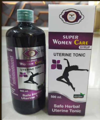
SUPER WOMEN CARE

MRP – 699/- DP – 370 /- BV – 5.9 ,, QUANTITY- 250 ML