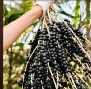
अकाई (आह-आह-ईई) जामुन

अकाई (आह-आह-ईई) जामुन में एंटीऑक्सीडेंट होते हैं जो हृदय स्वास्थ्य को बढ़ावा देने, याददाश्त में सुधार करने और कैंसर से बचाने में मदद कर सकते हैं। वे सूखे, जमे हुए, रस के रूप में, पाउडर के रूप में और अन्य रूपों में उपलब्ध हैं। Acai बेरी एक अंगूर जैसा फल है जो दक्षिण अमेरिका के वर्षावनों का मूल निवासी है। इन्हें अकाई ताड़ के पेड़ों से काटा जाता है।