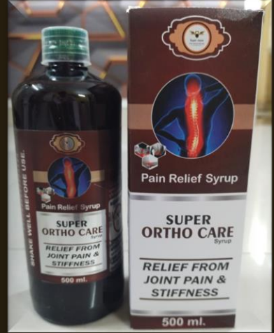
SUPER ORTHO CARE