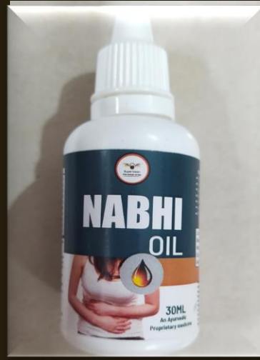
SUPER NABHI OIL

MRP – 699/- DP – 370 /- BV – 5.9 ,, QUANTITY- 250 ML