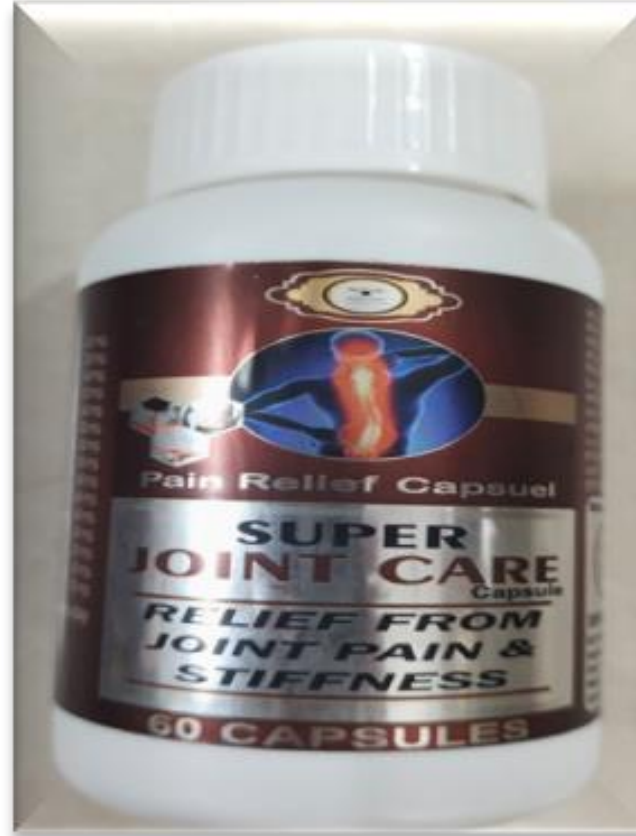
SUPER JOINT CARE 60 CAPSULE ,, 47.2 BV MRP 2199 ,, DP 1650