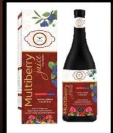
Multi Berry Juice(1000ml)