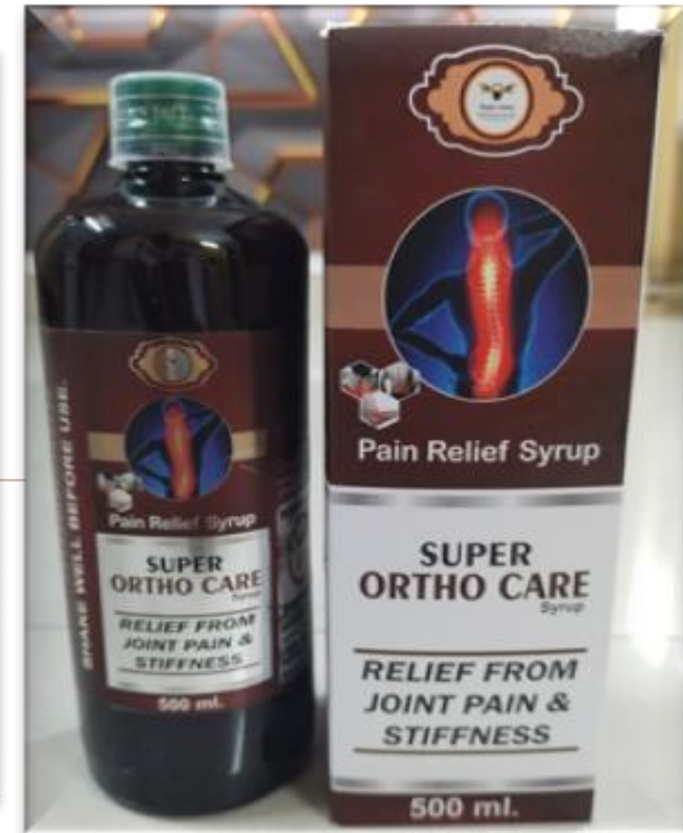
SUPER ORTHO CARE 500 ML ,, 20 BV MRP 1299 ,, DP 750

वातरोग, वातनाड़ी वेदना, संधिशोथ, गठिया, जोड़ो का दर्द, साईटिका, नाड़ी दोष-नाड़ियो में तनाव व दर्द, सूई चूभने जैसी पीड़ा, मांस- पेशियों में अकड़न, दर्द व सूजन, बढ़ती उम्र के कारण हड्डियों व जोड़ो के बीच चिकनाई में कमी आदि को दूर करने में लाभकारी।