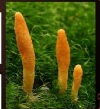
CORDYCEPS (KIDA JADI )

कॉर्डिसेप्स प्रतिरक्षा प्रणाली में कोशिकाओं और विशिष्ट रसायनों को उत्तेजित करके प्रतिरक्षा में सुधार कर सकता है। यह कैंसर कोशिकाओं से लड़ने और ट्यूमर के आकार को कम करने में भी मदद कर सकता है, खासकर फेफड़ों या त्वचा के कैंसर में। प्राकृतिक कॉर्डिसेप्स प्राप्त करना कठिन है और महंगा हो सकता है।