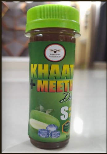
SUPER KHATTA MEETHA

MRP – 70/- DP – 30 /- BV – 0.5 ,, QUANTITY- 40 ML