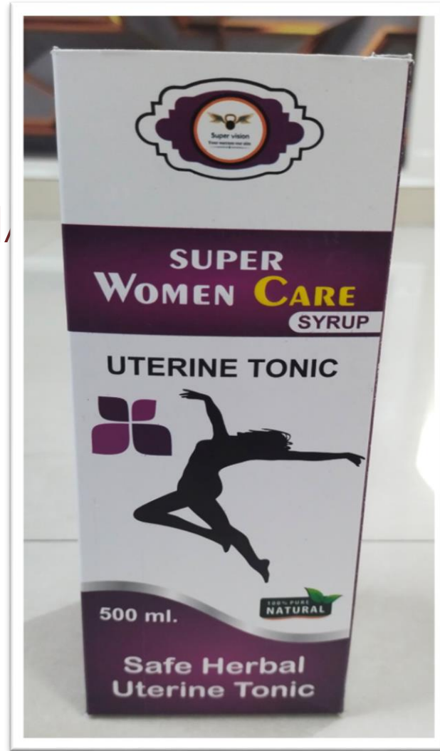
SUPER WOMEN CARE 500 ML