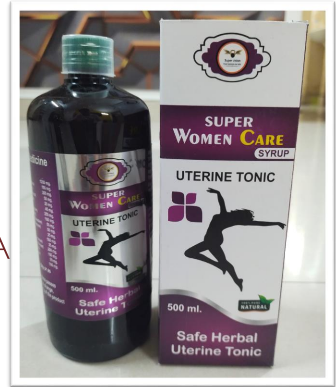
SUPER WOMEN CARE 500 ML