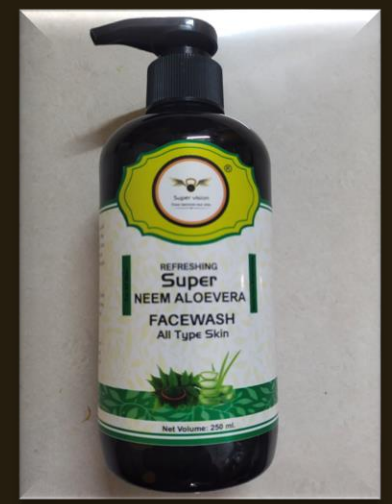
SUPER NEEM ALOEVERTA FACE WASH

MRP – 399/- DP – 170 /- BV – 02 ,, QUANTITY- 100 ML