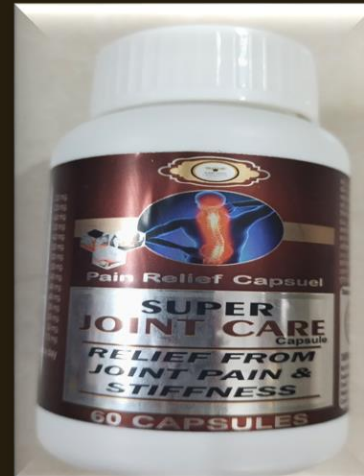
SUPER JOINT CARE