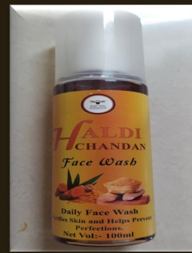
SUPER HALDI CHANDAN FACE WASH

MRP – 250/- DP – 139 /- BV – 1.5 ,, QUANTITY- 30 ML