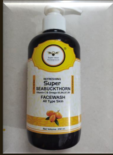
SUPER SEABUCKTHORN FACE WASH

MRP – 70/- DP – 30 /- BV – 0.5 ,, QUANTITY- 40 ML